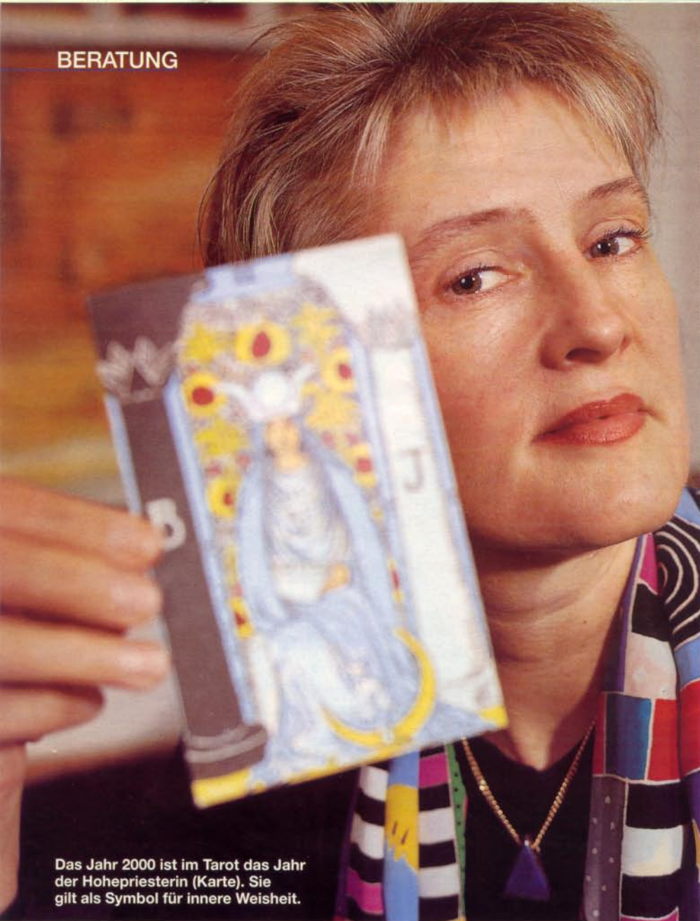
Das Jahr 2000 ist im Tarot das Jahr der Hohepriesterin (Karte). Sie gilt als Symbol für innere Weisheit.

leitet in Luzern eine Abteilung der Lehrerweiterbildung und ist in ein kleines Team eingebunden. Daneben ist sie in der Führungsschulung tätig und gestaltet Seminare. Als Basis dient ihr die prozessorientierte Kommunikationslehre des neurolinguistischen Programmierens (NLP). «Ich will mich nicht als allwissend aufspielen, sondern das vorhandene Potenzial der Leute stärken», beschreibt sie ihr Arbeitsprinzip, das auch beim Tarot zum Zug kommt.