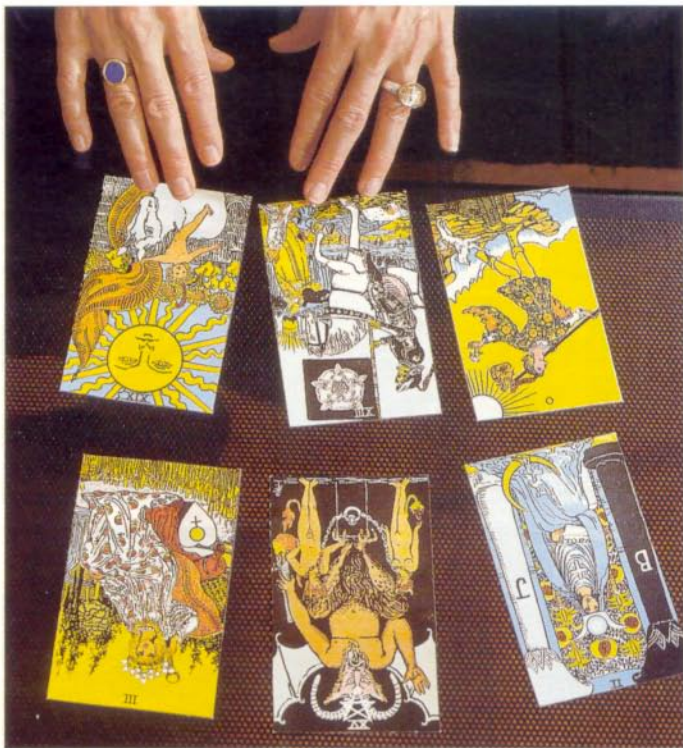
Die Karten Narr, Tod und Sonne (obere Reihe von rechts) der grossen Arkana umreissen das dem Tarot innewohnende Modell und deuten den Selbstfindungsprozess des Menschen an.

Auf Wolken schwebt die Tarot-Fachfrau im Berufsalltag aber keineswegs. Die ausgewiesene Arbeitspsychologin